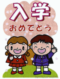
ニュータウンの新一年生

この4月、ニュータウン地区では90人のお子様 が小学校に入学しました。新入学のみなさん には、子ども会役員の協力を得て、お祝いの図 書券をお贈りしました。子どもたちの成長を ニュータウンらしい温かな心で見守っていきたい と思います。